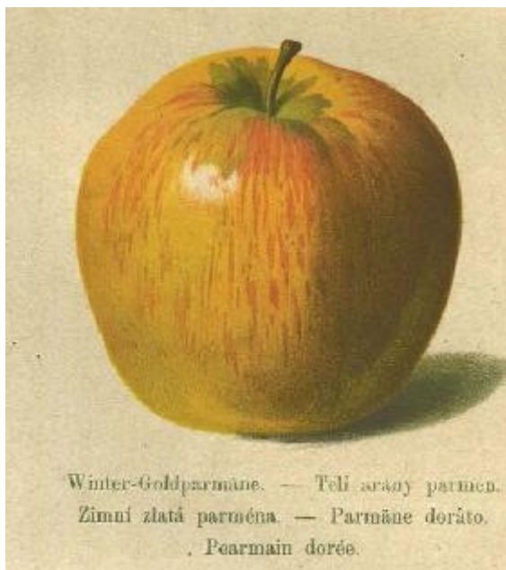
Stoll 1888 Pomologie.

ORIGINE : Anglaise avant 1795. Propagée en France et à l'étranger par les pépinières Leroy d'Angers, depuis le 19 e siècle jusqu'aux environs de 1920. Décrite par Mas, Le Verger, 1868, t.IV, n°8, par W.Lauche, Deutsche Pomologie, 1882, n°21, par A.Bivort, Annales de pomologie belge et étrangère, 1858, t.VI, p.11 et réédition 1998, p.581. Conservée à Brogdale (the book of apples, 1993, p.226)- Confondue, à tort, par certains auteurs, avec Reine des Reinettes (Queen of the pippin).